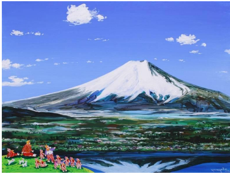
《早春的富士》，压克力 画布，2018 年作，46 x 61 公分

香港，2019年5月9日 天成国际将于5月24至28日在珠宝及翡翠春季拍卖预展期间举行「彩见 —— 山形博导艺术展」，呈献15幅山形博导 (Hiro Yamagata) 之杰作，作品可于现场洽购。山形博导是著名的美籍日本艺术家，画作明亮多彩，风格出众。其创作独特之处，在于透过娴熟的技巧及表达能力，运用200种以上的鲜艳颜色，成就色彩丰富的艺术世界。今次展览作品以小人国以及花为主题，除了丝网印刷版画，更包括珍贵的原画作品。山形博导的压克力原画作品数目稀少，极具收藏价值。