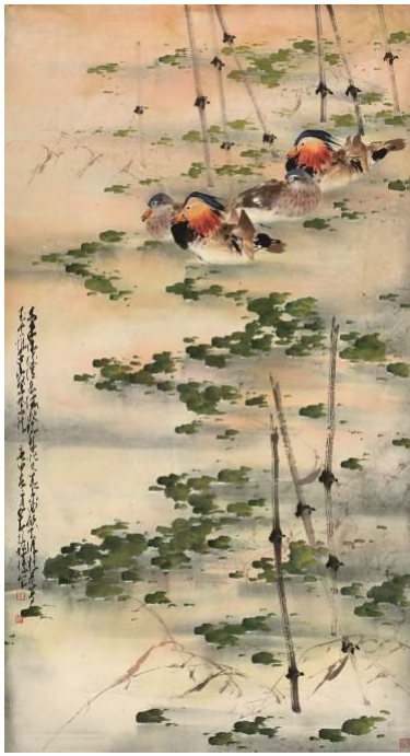
赵少昂《鸳鸯》 1980 年作