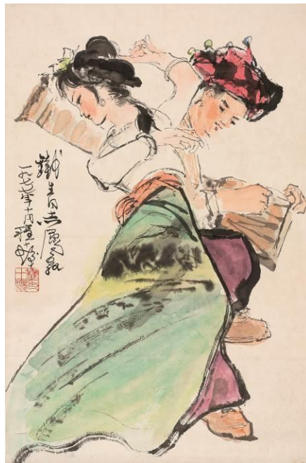
程十发《傣族长鼓舞》

估价: HK$ 350,000 - 400,000 / US$ 45,200 - 52,000