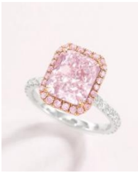
(图左) 拍品编号 88